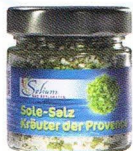
Solium Sole-Salz Kräuter der Provence